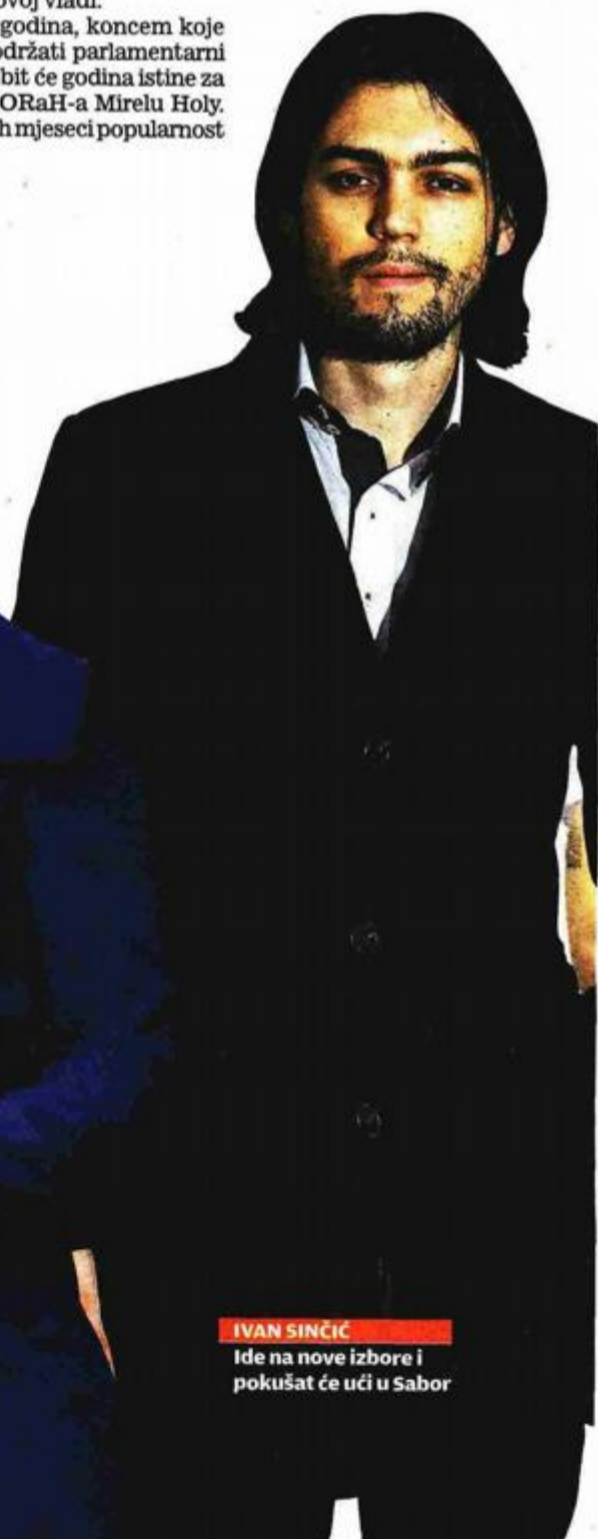
IVAN SINČIĆ Ide na nove izbore i pokušat će ući u Sabor