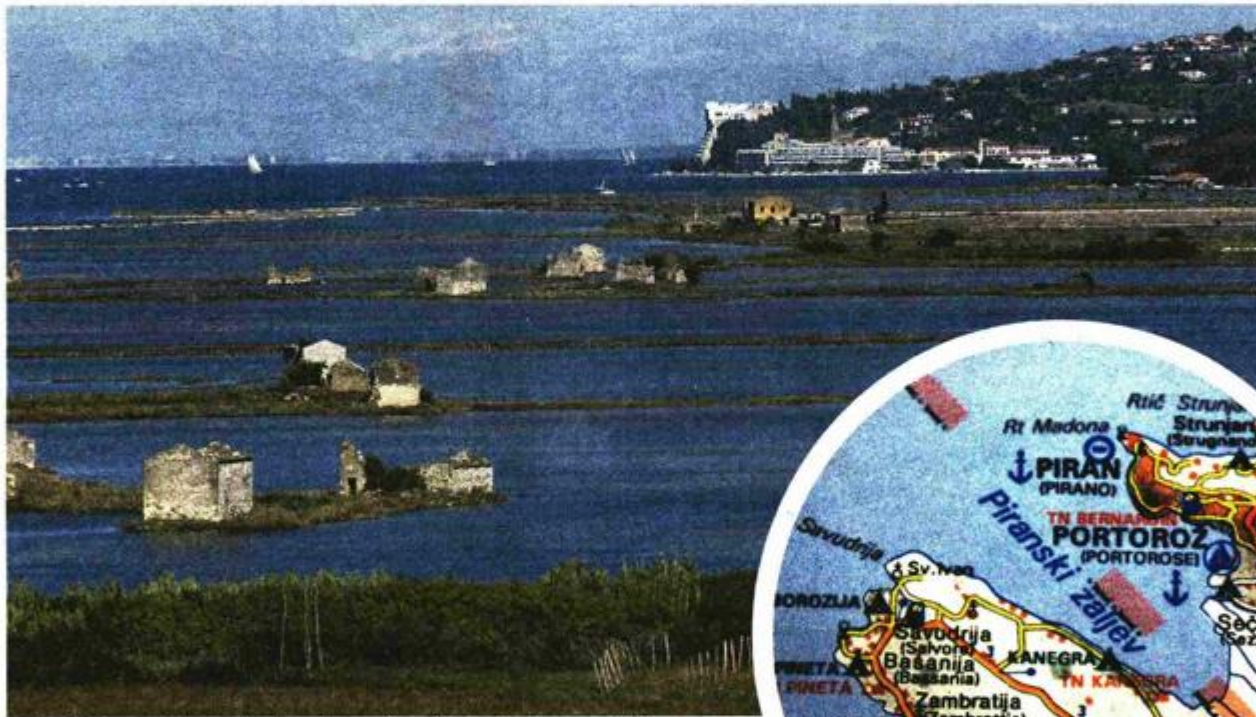
Dobije li Slovenija dvije trećine Piranskog zaljeva, Hrvatska će na tom dijelu prestati graničiti s Italijom, što bi bilo jako štetno, prije svega za Istru

Račan pozvao neposredno prije nego što je parafiran sporazum.